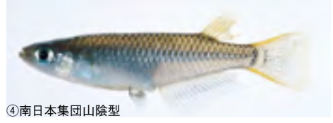
④南日本集団山陰型