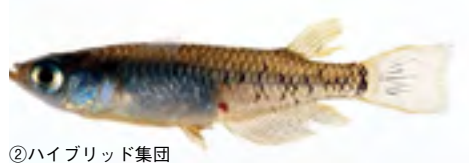
②ハイブリッド集団