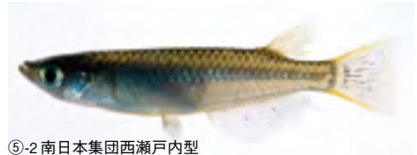
⑤-2南日本集団西瀬戸内型