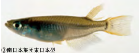
③南日本集団東日本型