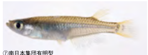
⑦南日本集団有明型