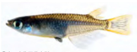
⑧南日本集団薩摩型