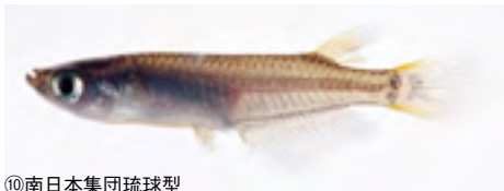
⑩南日本集団琉球型