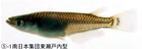
⑤-1南日本集団東瀬戸内型