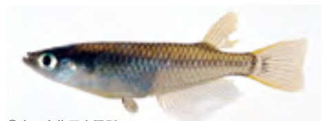
⑨南日本集団大隅型