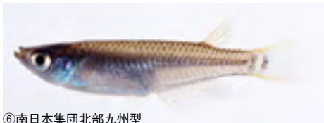
⑥南日本集団北部九州型